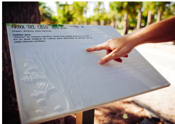
Figura 2. Placa táctil, Parque Inés de Suarez.

El cerebro construye múltiples representaciones del espacio peripersonal, las cuáles son rápidamente modificables y están centradas en diferentes partes del cuerpo (Di Pellegrino & Ládavas, 2015). Estas representaciones permiten la creación de mapas de la superficie del cuerpo y sus alrededores, permitiendo ubicar objetos en el espacio, y surgen a partir de la interacción de neuronas multimodales ubicadas en las cortezas parietales y temporales que responden a estímulos visuales, táctiles y auditivos. Algunas de estas neuronas responden a estímulos ubicados muy cerca de la superficie del cuerpo, mientras que otras responden a estímulos más lejanos, siempre dentro del espacio peripersonal (Di Pellegrino & Ládavas, 2015). Interesantemente, estas neuronas codifican la ubicación del objeto con respecto a partes del cuerpo (cabeza o manos) y no con respecto a las superficies sensoriales propiamente tal (Di Pellegrino & Ládavas, 2015). La función de esta representación del espacio peripersonal es, aparentemente, actuar como interfase multisensorial con el sistema motor, facilitando la respuesta motora ante un objeto ubicado en el espacio peripersonal, típicamente movimientos de cabeza, brazos y manos dirigidos hacia el objeto o lejos de él (Di Pellegrino & Ládavas, 2015).